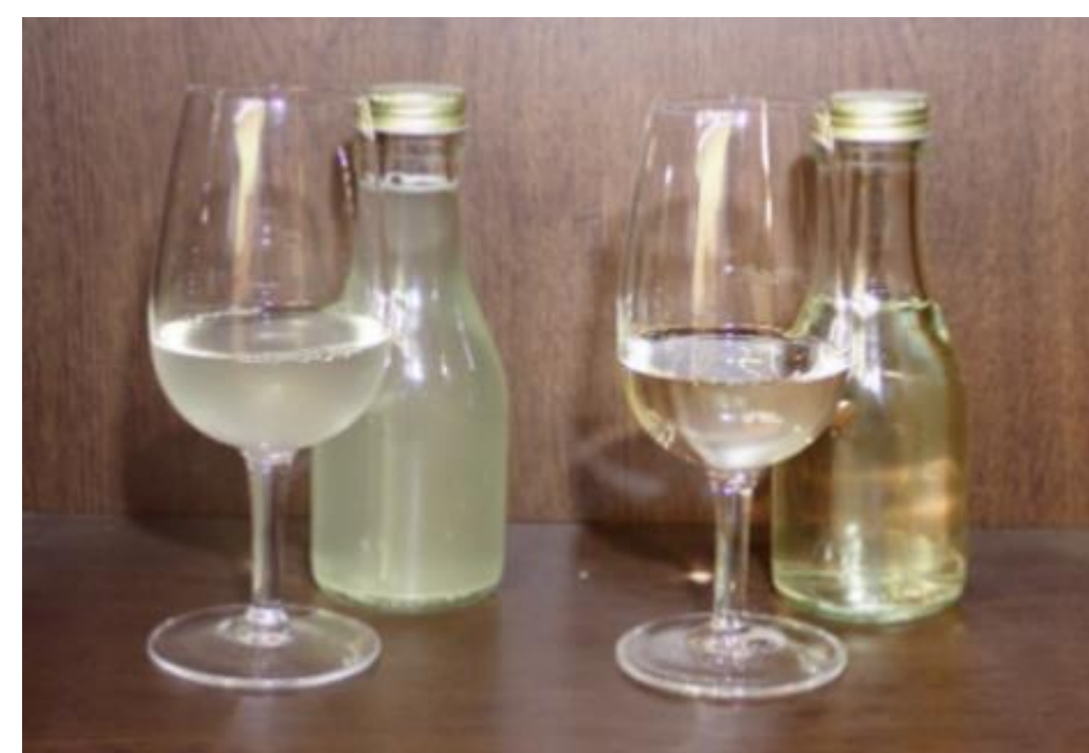
図2 オリ下げ処理の有無による ブレンドワインの外観の差異 (左：未処理 右：オリ下げ処理)