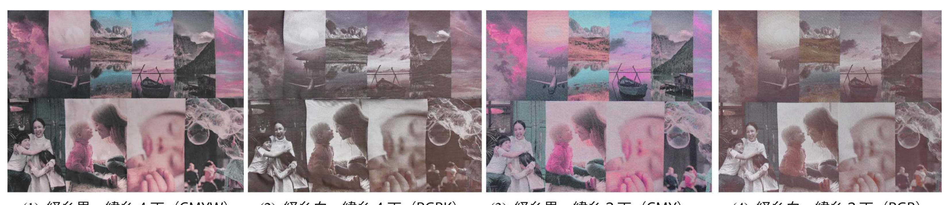
図3 緯糸3色（3D）と4色（4D）の試織結果の比較